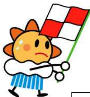
はれるん （気象庁マスコットキャラクター）