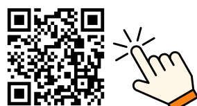
特設ページQRコード