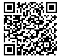
申込フォームQRコード

WEB申込URL： https://c0bb449b.form.kintoneapp.com/public/1214kanminnrenkei