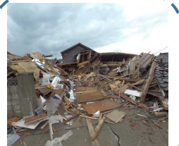
令和6年能登半島地震