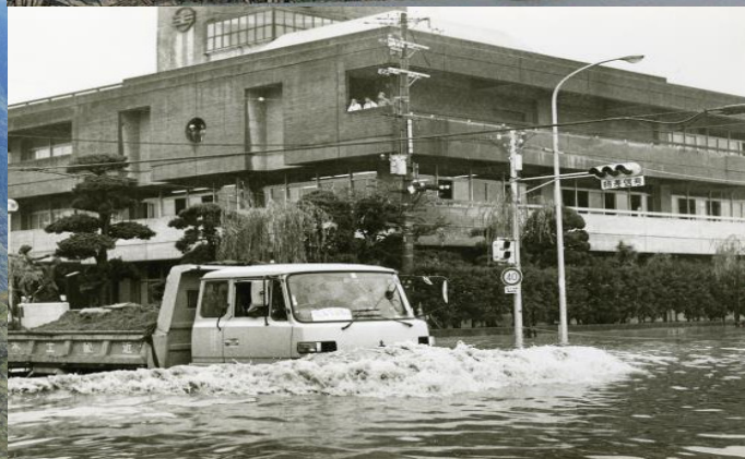
冊子『歴史から学ぶ 奈良の災害史』より