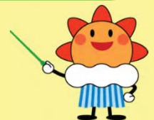
気象庁マスコットキャラクター「はれるん」

ご記入いただいた個人情報は適切に管理し、ご本人確認のための情報として利用させていただきます。 ご本人の同意なしにそのほかの目的での利用・提供はいたしません。