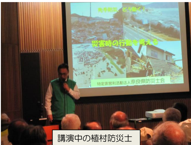
講演中の植村防災士